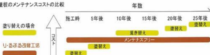
●屋根のメンテナンスコストの比較